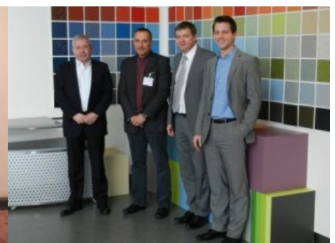
Die Firma Nora aus Weinheim spendete den Fußboden für die Schule.