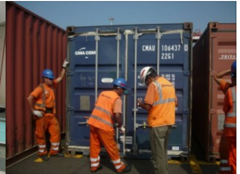
Container Nr. 32 wurde fünfmal von den Behörden entladen. Ein weiteres Beispiel für die Probleme im Zoll bei der Einfuhr von Hilfsgütern.