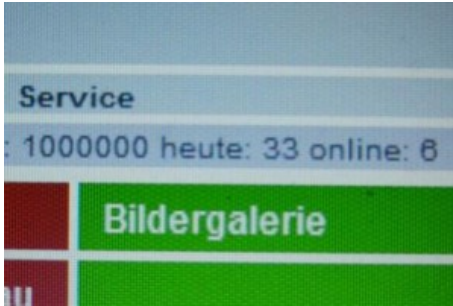
14. Januar: Der Einmillionste Besucher auf unserer Webseite