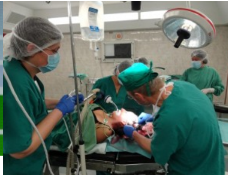
18. Januar: Schwerer Busunfall. Das Team leistete großartige Arbeit