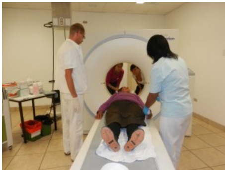
Patientenbesuch 100.000. Die Patienten benötigte eine CT-Aufnahme ihres Kopfes. Auf der anderen Seite erkennt man die beiden Journalistinnen von SOMOS.