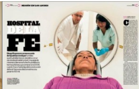
Fünf Seiten in SOMOS, der wichtigsten Wochenzeitschrift Perus