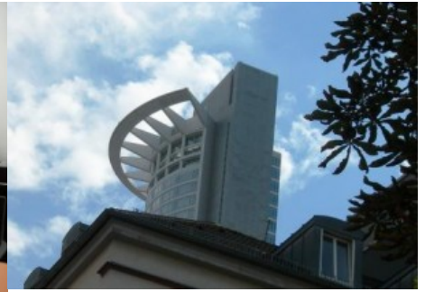
Im Finanzzentrum Frankfurts