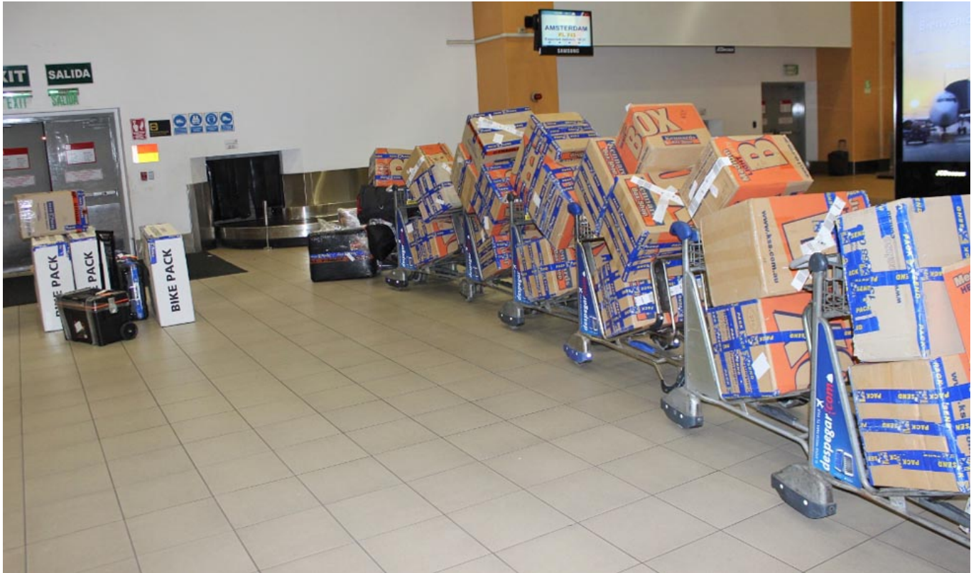
Wenn es weiter nichts ist.