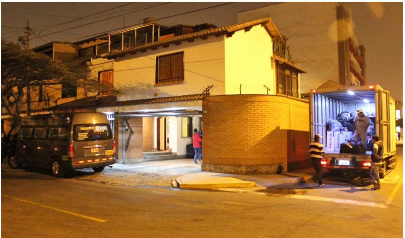
Ankunft in der Nacht am Gästehaus von Diospi Suyana