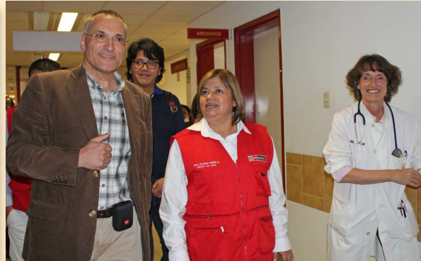
▲ Die Ministerin inspizierte alle Abteilungen des Spitals.