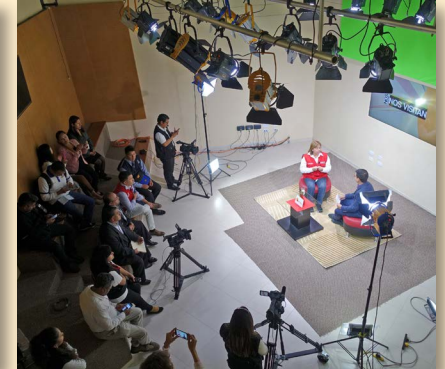
▲ Interview in unserem TV-Studio