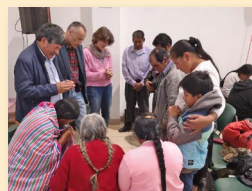
Eine der vielen Gebetsgruppen im Kirchsaa

Über 100.000 Peruaner versammelten sich am 29. Juni an verschiedenen Orten, um für ihr Land zu beten. In Curahuasi trafen sich rund 100 Vertreter von