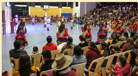
▲ Ein Folkoretanz der Schüler

Das fünfte Geburtstagsfest der Diospi-Suyana-Schule war der Höhepunkt einer aufwendigen Projektwoche. Es bildeten sich 17 Schülergruppen über alle Klassen- und Altersgrenzen hinweg. Sie beschäftigten sich u. a. mit Vogelkunde, Tierschutz, Aquarellmalerei, Schach und Robotik. Andere untersuchten lokale Mythen und Legenden. Bei der Jubiläumsfeier am