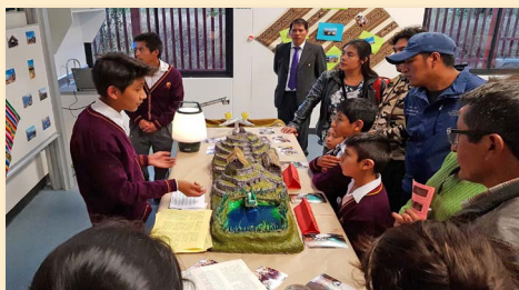
▲ Zukünftige Experten für Archäologie