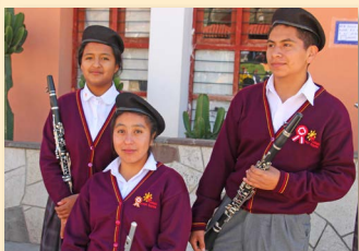
Schüler der Schulband warten auf ihren Einsatz.

Diospi Suyana e. V. BFS Köln BIC: BFSWDE33XXX IBAN: DE18 3702 0500 0008 0737 00