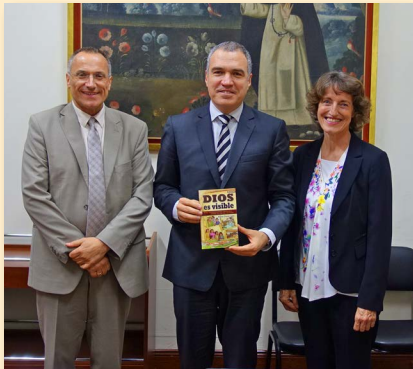
▲ Beim Premier Salvador del Solar