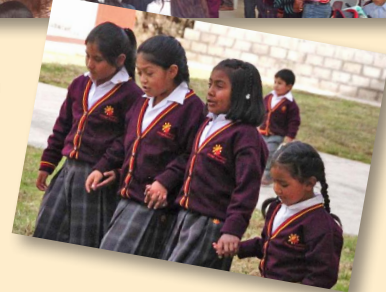
Schulmädchen in Uniform ▶