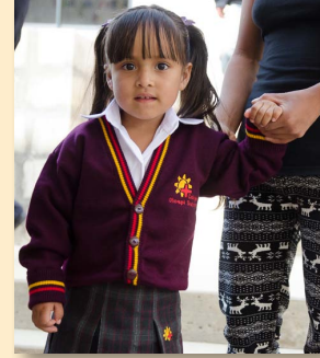
▲ Mit Ihrer Hilfe in eine bessere Zukunft