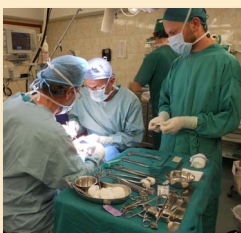
▲ Überstunden im OP