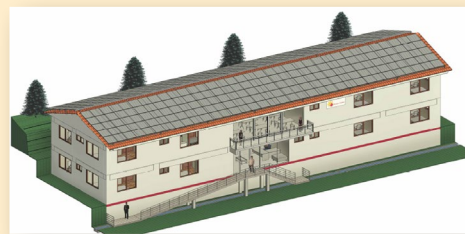
▲ 630 m 2 Wohnfläche in Hanglage