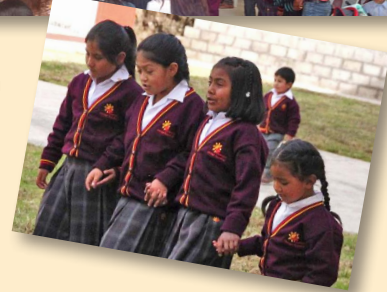
Schulmädchen in Uniform ▶