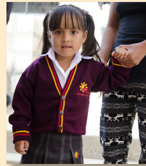
▲ Mit Ihrer Hilfe in eine bessere Zukunft