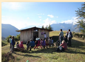
Eine Kinderstunde in Puca-puca in 3.500 m Höhe

Diospi Suyana e. V. BfS Köln Konto-Nr. 8 073 700 BLZ 370 205 00