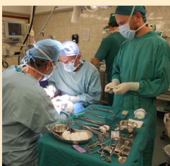
▲ Überstunden im OP