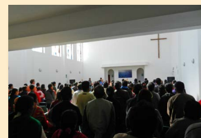
▲ In der Gegenwart Gottes

Der Morgengottesdienst im Spital beginnt. Als die Liedzeile "Vine a alabar a Dios" (Ich kam, um Gott zu loben) auf dem Bildschirm erscheint, erheben sich die Patienten spontan von ihren Stühlen. Niemand hat sie dazu aufgefordert. Die Stimmung ist ehrfürchtig und feierlich. Selbst viele Atheisten kennen das Gefühl der "Transzendenz" – die Ahnung von einer höheren Macht. Hat die Bibel vielleicht recht, dass Gott die Ewigkeit in unsere Herzen gelegt hat?