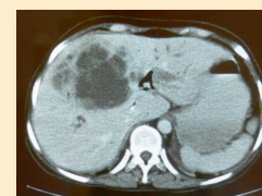
▲ Im CT zeigte sich die Eiteransammlung als schwarzer Fleck.