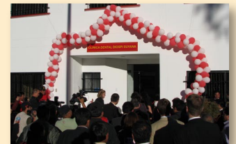
▲ Dichtes Gedränge am Eingang zur Dentalklinik