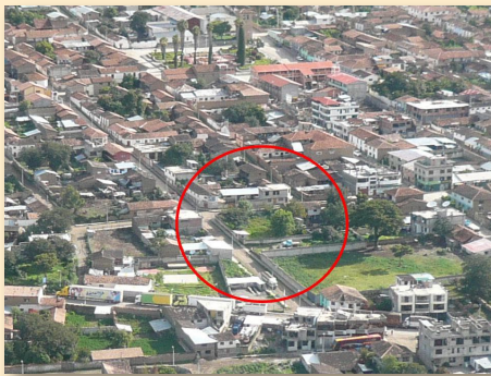
▲ Das Gelände liegt mitten in Curahuasi in einer ruhigen Seitenstraße.

Dieses Gebäude wird multifunktional genutzt werden. Die gesamte untere Etage ist für die Kinderclubs vorgesehen. Auch eine Zwergschule für Missionarskinder könnte in diesen Räumlichkeiten untergebracht werden.