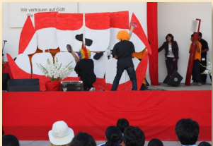
Folkloretanz einiger Mitarbeiter ▶