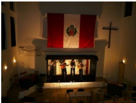
Das erste Konzert in der Krankenhauskirche

Etwa 7000 Ärzte fehlen in Peru um ein Minimum an Service im Gesundheitswesen anbieten zu können.