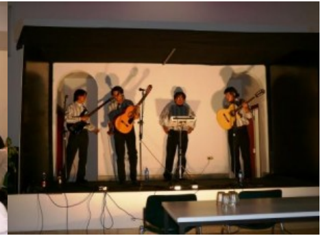
Die Musikgruppe "Renacer" spielte Folklore Musik zum Ausklang

Etwa 7000 Ärzte fehlen in Peru um ein Minimum an Service im Gesundheitswesen anbieten zu können.