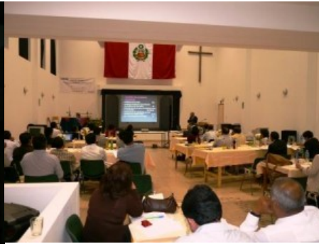
Referate am Nachmittag