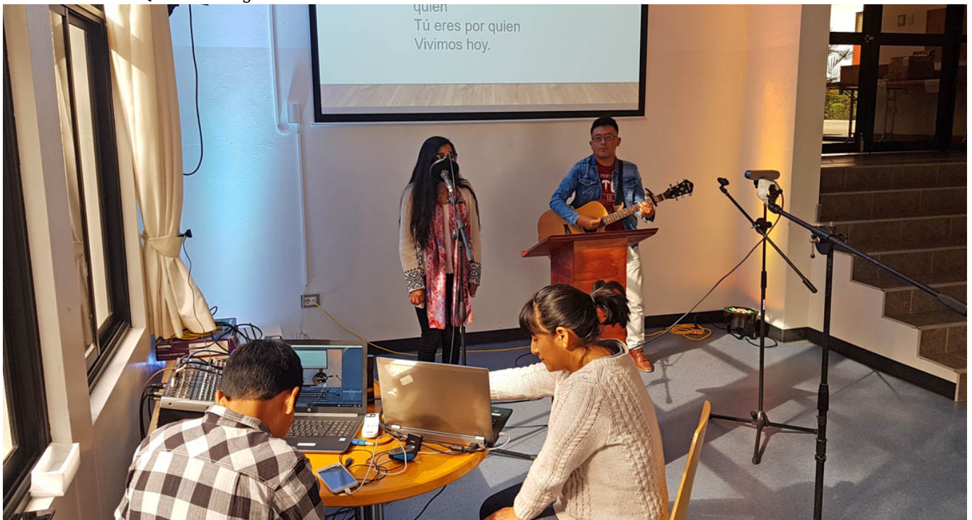
Während der Aufnahmen für den Gottesdienst