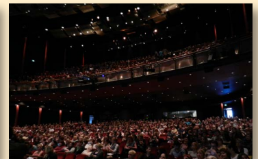
▲ Theater am Marientor in Duisburg: Spannung pur beim Vortrag über Diospi Suyana