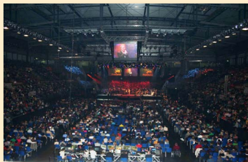
▲ Die ProChrist-Abende wurden aus der Porsche Arena in Stuttgart ausgestrahlt.

halbe Stunde dem „Krankenhaus des Glaubens“. Zu Ostern folgte die Wiener Zeitung mit einem großen Artikel. Schließlich hielt der Missionsarzt am 7. Mai einen Vortrag vor 1.500 Zuhörern auf dem Pflegekongress in Duisburg. Auch diesmal ging es um den zentralen Aspekt des Glaubens.