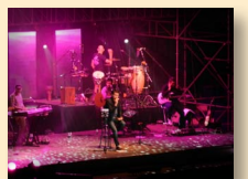
Jesús Adrian Romero

Unter den vielen Tausend Menschen im Kolosseum zu Cusco sitzen auch Mitarbeiter von Diospi Suyana. Als Jesús Adrian Romero „Que sería de mi“ anstimmt, stehen alle auf und singen mit. In Südamerika kennen Millionen diesen Song aus dem Radio. Der Mexikaner beschreibt, was ein Leben ohne Gott für ihn bedeuten würde. „Was wäre mit mir, wenn Du (Gott) mich nicht erreicht hättest? Wo wäre ich heute, wenn Du mir nicht vergeben hättest? Ich hätte ein Vakuum in meinem Herzen. Ich würde ohne Sinn und Ziel vor mich hin leben. Wenn es nicht Deine Gnade und Liebe gäbe!“